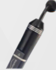
Oksijenli Köpük Kalemi